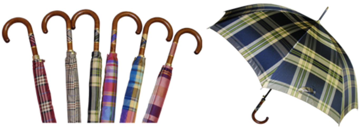
CLAN - Parapluie de ville, tringle métallique dorée renforcée, poignée courbe bois et tissu écossais assorti