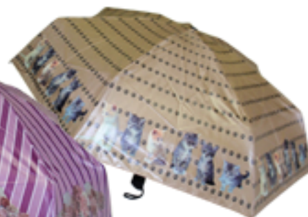
2005 - Parapluie micro-plat, ouverture et fermeture automatique, monture acier/fibre de verre, 22 cm fermé, diamètre ouvert 92 cm, poids 220 gr