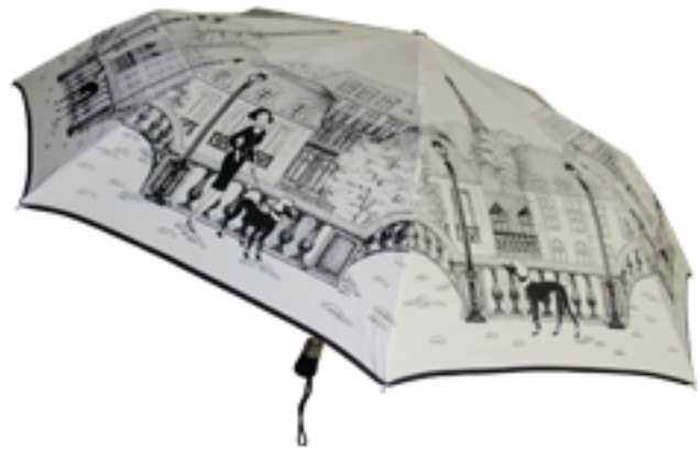
3405 - Parapluie mini automatique, monture acier, renforts carbone, 29 cm fermé, diamètre ouvert 100 cm, poids 395 gr