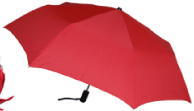
6100 - Parapluie pliant, ouverture et fermeture automatique, 27 cm fermé, diamètre ouvert 100 cm, poids 330 gr