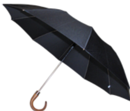
12002 - Parapluie pliant, ouverture automatique, monture acier, 10 baleines, windproof