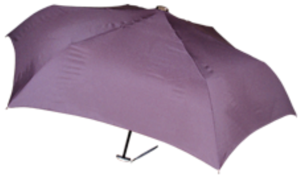
7000 - Mini parapluie, extra-plat, monture acier, 23 cm fermé - diamètre ouvert 92 cm - poids 215 gr