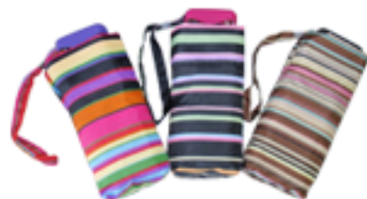
5006 - Parapluie micro mini plat, monture aluminium, carbone renforcé