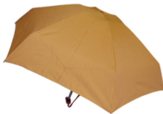
5002 Unis - Parapluie micro-plat manuel Monture aluminium, carbone renforcé, 15,5 cm fermé diamètre ouvert 93 cm - poids 200 gr