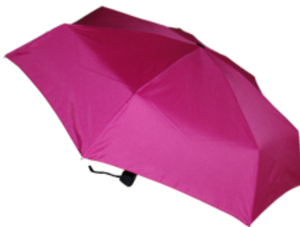
2004 - Parapluie micro-plat, ouverture et fermeture automatique, monture acier/fibre de verre, 22 cm fermé, diamètre ouvert 92 cm, poids 220 gr