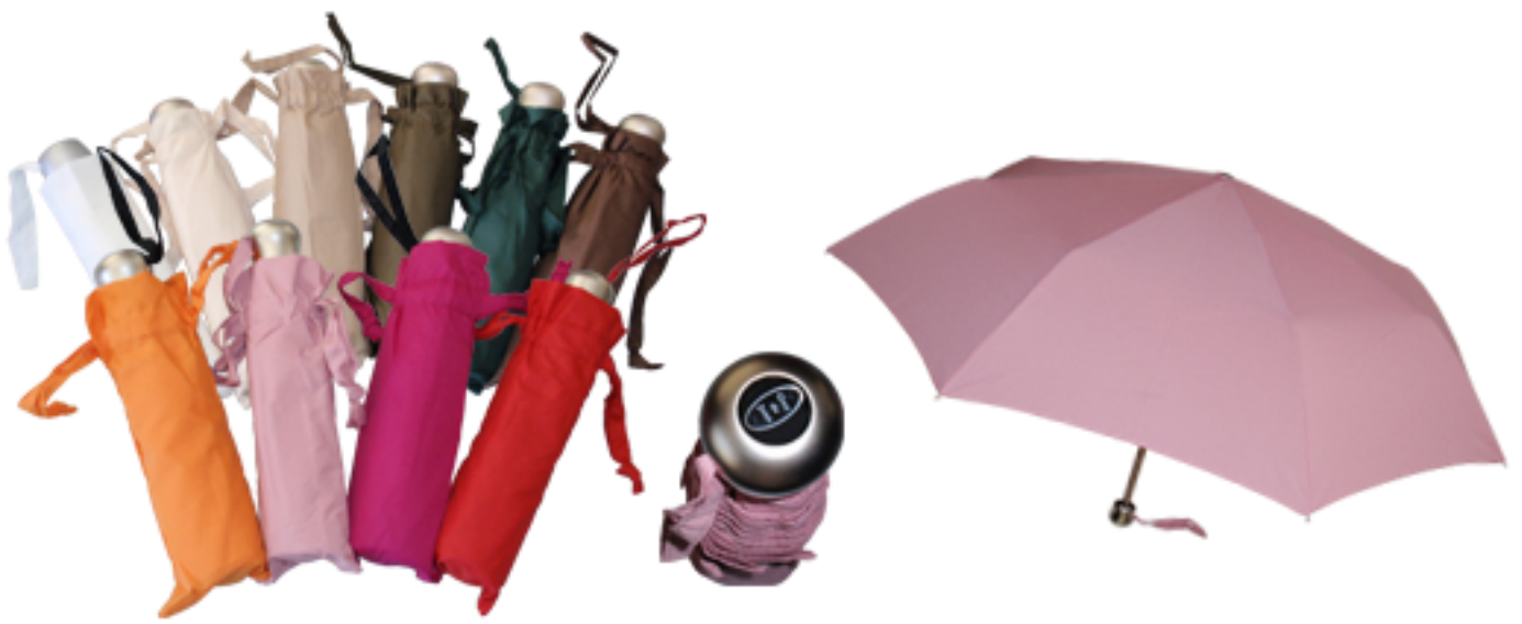
102110 - Mini parapluie, monture aluminium, renforcé carbone + Téflon - Diamètre ouvert 97 cm