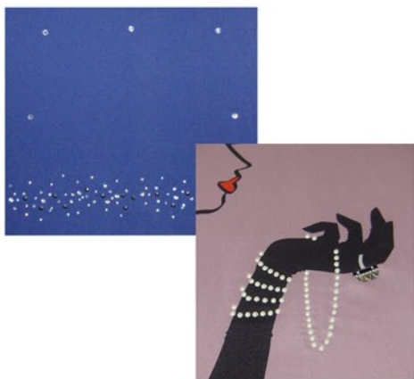
Pose de transfert Combinaison sérigraphie et pose de perles, strass...