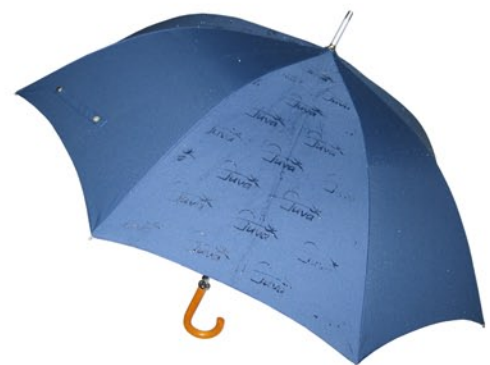
Impression "magique" (le motif apparaît lorsqu'il pleut) A partir de 600 pcs