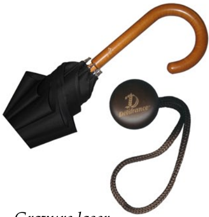
Gravure laser sur poignée bois