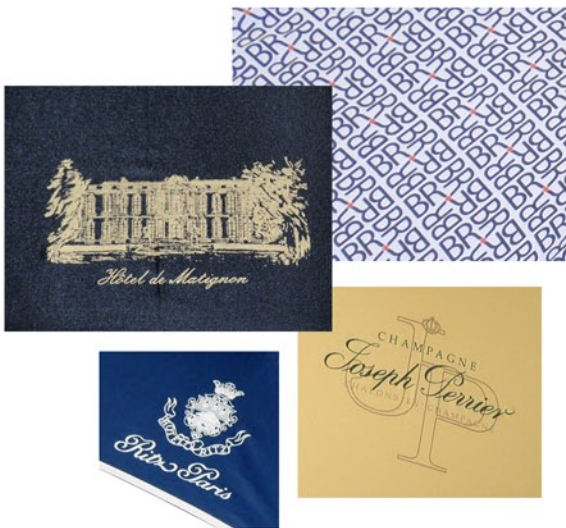
Impression sérigraphique (motif placé, semis, frise...)